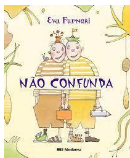
Não confunda Eva Furnari 3ª Edição – 2011 Editora Moderna