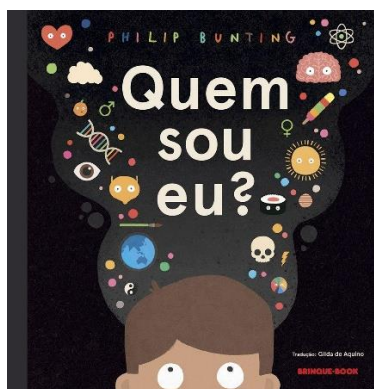
Quem sou eu? Philip Bunting Brinque – Book,