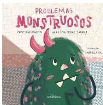
Problemas Monstruosos - Cristiane Boneto