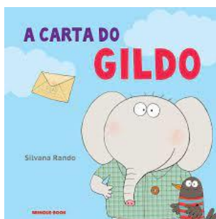
A Carta do Gildo Silvana Rando Editora Brinque Book