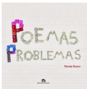
Renta Bueno Poemas Problemas Editora do Brasil