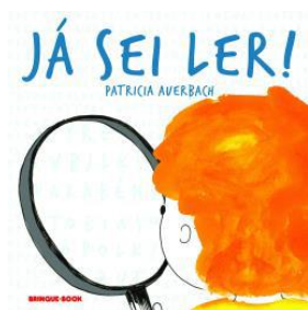
Já sei ler. Patrícia Averbach. Editora Brinque Book