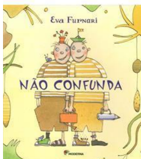
Não confunda. Eva Furnari 3ª Edição - 2011