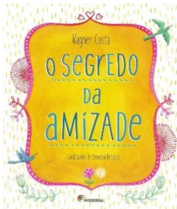
O Segredo da Amizade Wagner Costa Editora Moderna